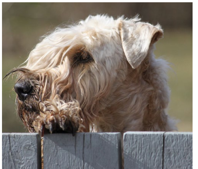
Rustylla (Geijes Yngsdale) oli oikea terrieri-ilme, niinkuin vehnillä kuuluu olla.