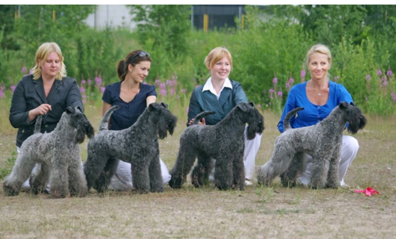
Ensimmäinen BIS-kasvattajaryhmävoitto kaikkien rotujen näyttelyssä v. 2009. Ryhmässä neljä hyvin voitokasta narttua: Geijes Crystal Shine, Geijes Artful Eye, Geijes Zentara's Pearl ja Geijes Compass Rose. Kaikki nartut harrastivat myös agilityä ja kolme niistä kilpaili korkeimmassa tasoluokassa.

Aya oli alkuun Suomessa ainoa alkuperäisen Irish Soft-Coated Wheaten Terrierin kasvattaja. Koska jalostusmateriaalia ei ollut ja Suomen tiukat tuontirajoitukset vaikeuttivat koirien maahan-tuontia, hän toi koiria pennunkyselijoille, jotka ymmärsivät rodun