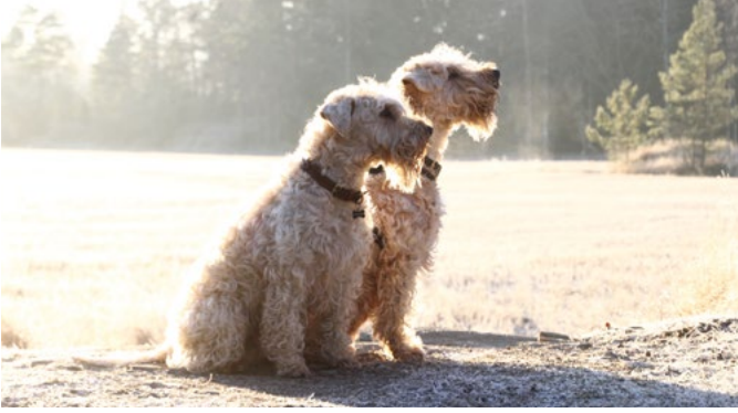
Kaksi oiraa perheenjäsenenä samaan aikaan on Ayalle sopiva määrä. Ne ovat myös hänen parhaimmat ystävänsä. Kuvassa vas. Geijes Finnla Fink ja oik. Geijes Yngsdale.