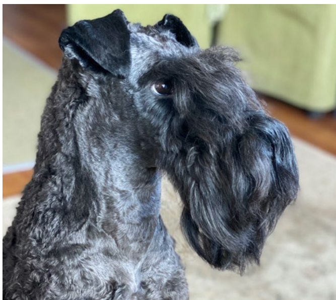
Lyra (Geijes Jewel of The Sky) on perinyt valppaan katseensa isältään.